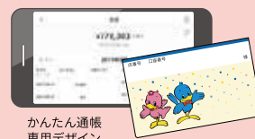
かんたん通帳専用デザイン

通帳アプリ「かんたん通帳」と連携して、入出金の明細を確認できます。 スマートフォンが通帳代わりになり、かんたん通帳専用のデザインもあります。